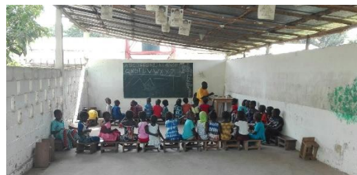
Una clase de la Escuela de Alfabetización que Catalunya-Casamance tiene Kafountine (Senegal).

Con Catalunya-Casamance, una asociación que realiza una acción directa sobre la población de Kafountine (Senegal) facilitando el acceso a la educación de los niños y la población adulta, un activo de la Ramon Molinas Foundation ha participado, durante quince días, en las actividades de la Escuela de Alfabetización.